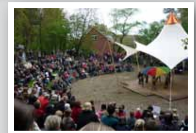
Die Waldbühne bietet vielfältige Möglichkeiten für das örtliche Leben. Aufführungen, Theater und Kleinkunst gehören zum Programm. Weiterhin wird sie auch von den Schülern der angrenzenden Schule genutzt.