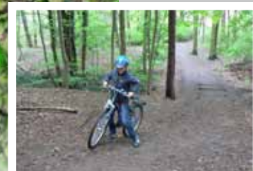
Die Fahrradcrossstrecke wurde mit dem Jugendtreff als schmaler Pfad auf bewegtem Gelände ausgebaut. So ist ein 400 m langer Rundkurs entstanden.