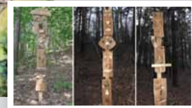
Um den Schulwald vom Bürgerpark abzugrenzen, wurden von den Schülern in Anlehnung an den Baumskulpturenpfad Objekte in der Art von Totempfählen errichtet.

So heißt es, dass der König im goldenen Wagen unter dem Paaschberg begraben liegt, während die anderen Hügel in der Umgebung seine Heerhaufen bedecken.