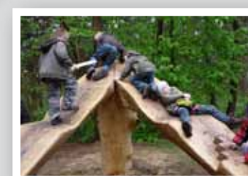
Von den Sterneguckern (massive Kletter- und Liegebänke) zu Füßen des Aussichtsturms können Sie nachts den Sternenhimmel bewundern.