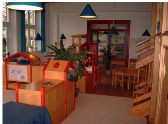
Blick zum Konferenzraum