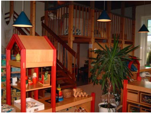
Galerie und Kinderwohnung