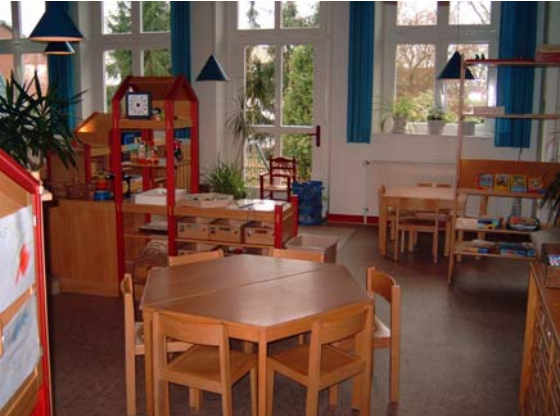
malen spielen lesen