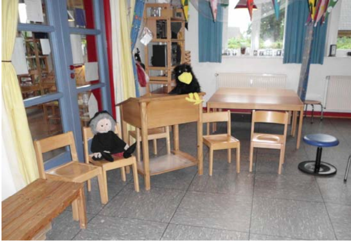
Platz zum Versammeln /Diskutieren /Besprechen