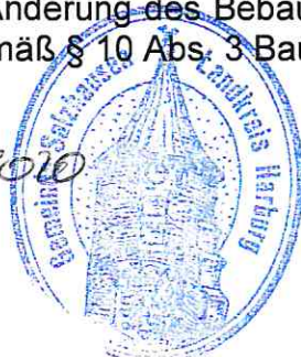
Wolfgang Krause - Gemeindedirektor -